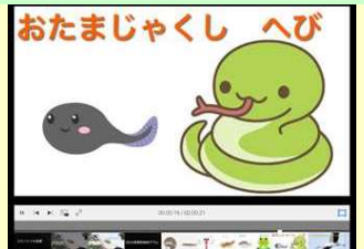
イラストを入れてみたり