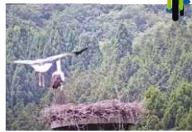
越前市農政課ライブ映像より