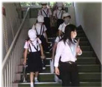
どの学年も、緊張感をもって訓練できました。