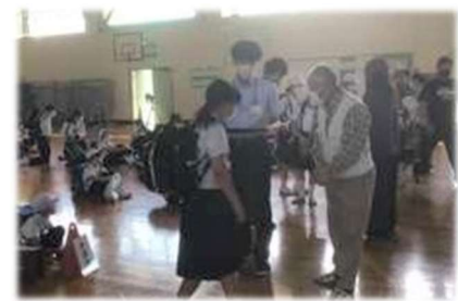
家庭環境調査票で確認して引き渡しました。