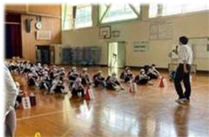
町内ごとに整列して迎えを待ちます。

保護者が迎えに来られないことも想定されます。その時は、教員が引率して、 坂井市ゆりの里公園 へ移動することになるようです。