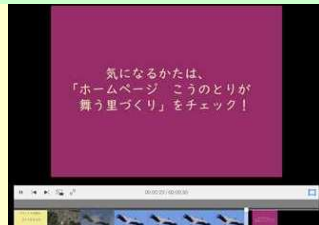
音声の説明を入れたり