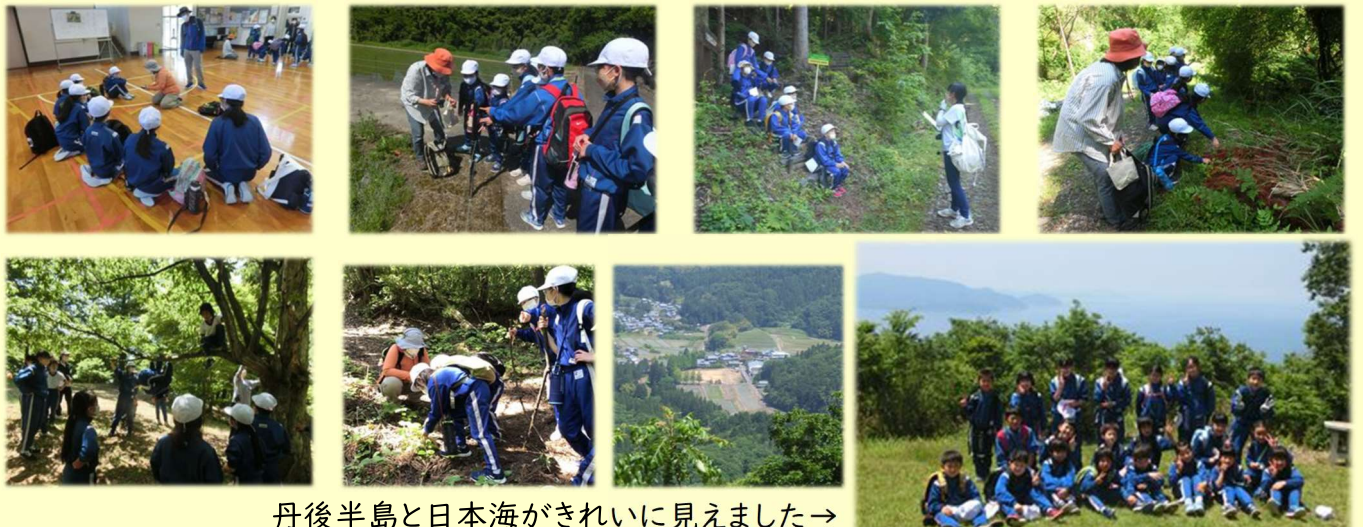
丹後半島と日本海がきれいに見えました→