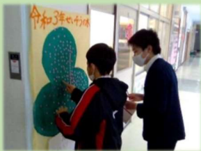
「せいそうの木」のシールの数で、みんなの掃除の頑張り具合を確認中。