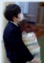
学級文庫の本を入れ替えています。