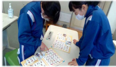
オーロラが見られて英語を話す国のご出身です。 特産品はメープルシロップです。 さて、どこでしょう