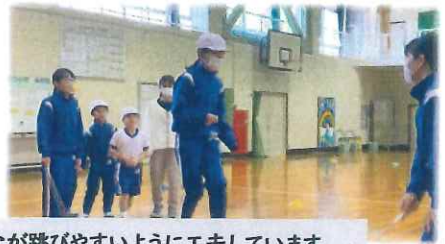
縄を回す高学年は、みんなが跳びやすいように工夫しています。