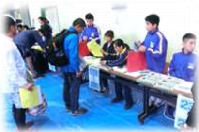
「受付で～す。ゼッケンと参加賞をどうぞ。」