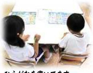
ひらがなを書いています。