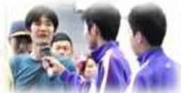
緊張のクイズタイム。インタビューもしっかりできました!