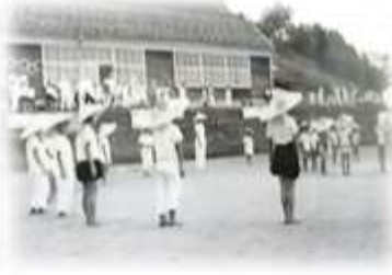
昭和45年地区体育大会の様子