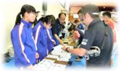
「記録証をお渡しますよ～何番ですか～」