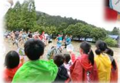
「がんばれー(みんなもうどろだらけやな)」