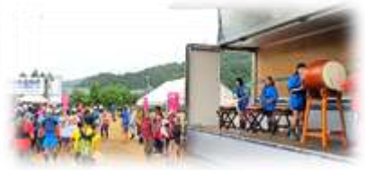
小学生の太鼓の合図でスタート!