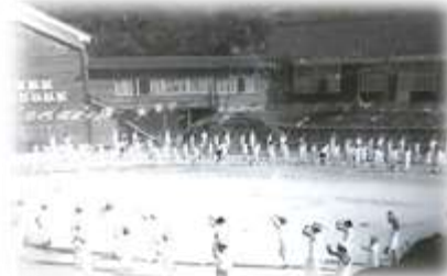
昭和44年地区体育大会の様子