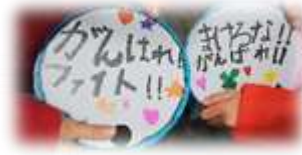
中学生が作ったうちわにメッセージを書いて。