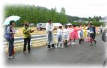
第2エイドで応援。選手とハイタッチ!