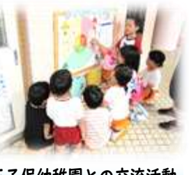
王子保幼稚園との交流活動