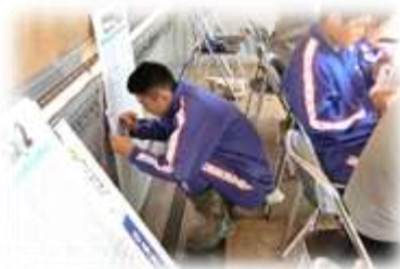
掲示板に記録を書き込みます。