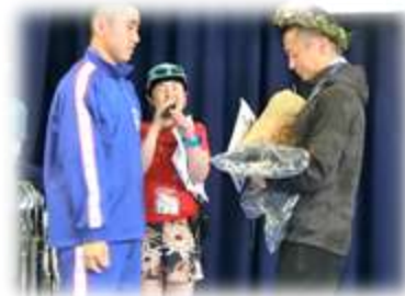
「優勝おめでとうございます。ぼくたちが作った王冠すごいでしょ!!」