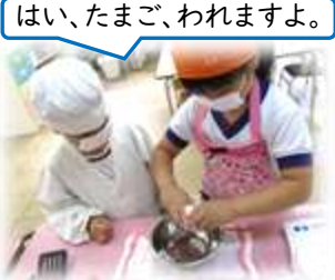
誕生日会クッキング