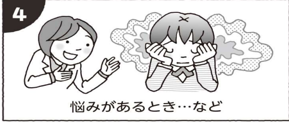
悩みがあるとき…など