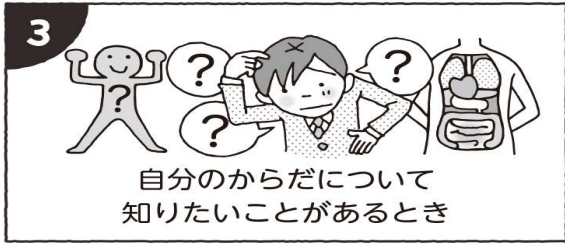
自分のからだについて 知りたいことがあるとき