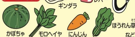
かぼちゃ モロヘイヤ にんじん ほうれん草 など