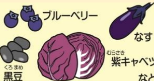
ブルーベリー なす 黒豆 紫キャベツ など

「目」の健康に役立つ栄養素と食べ物 サプリメントではなく、食事からとるのがおすすめです。