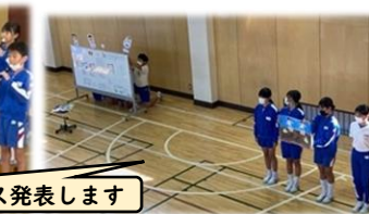
これまでの学びをブース発表します