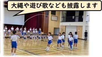
大縄や遊び歌なども披露します