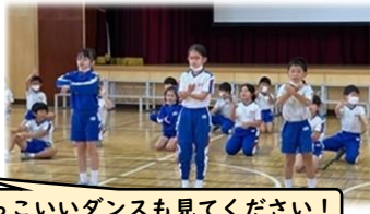
かっこいいダンスも見てください!