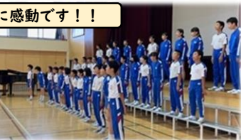
最高学年の堂々とした雄姿に感動です!!