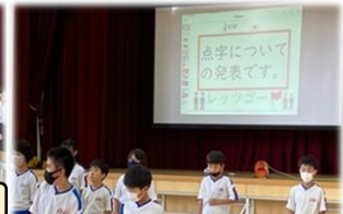
福祉について勉強しました