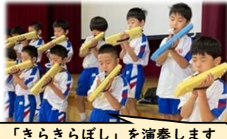
「きらきらぼし」を演奏します