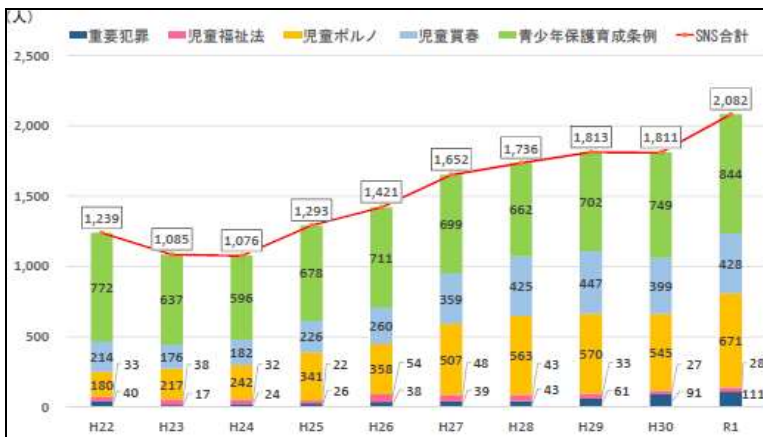
SNS等に起因する事犯の被害児童数の推移(全国)