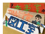
教室名の入った看板プレゼント!

後期の総合的な学習では、「ありがとう吉野小学校」をテーマに、各クラスで、感謝を伝えるために何ができるか、考えました。各クラスの取り組みの一部を紹介します。