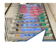
メッセージ入りの階段アート!