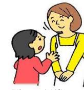
悩みや心配があるとき