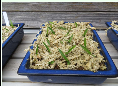
4月に植えた2年生のサギソウも大きくなりました。