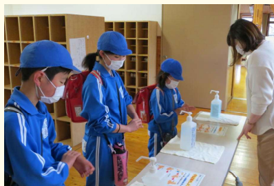
登校後の手指消毒

外出自粛が解除されて県内初の週末、JR福井駅周辺では新型コロナウイルスの感染防止策をしつつ食事や買い物を楽しむ家族の姿が見られ、にぎわいが少しずつもどってきたとのニュースがありました。学校の方では3月から休校が続いていましたが、いよいよ来週の6月1日（月）から再開となります。今月の12日から分散登校も始まっていますが、この間、保護者の皆様にはお子さんの健康保持や学習支援等にご理解ご協力をいただき誠にありがとうございます。休みが長期にわたっただけに子どもたちへの影響が心配されますので、子どもたちが安心して学校生活が送れますよう生活面でのケアを優先しながら、できることをしっかりやっていきたいと思っております。また、学校の新しい生活様式を浸透させながら感染レベルを低くし、教育活動に取り組んでいきます。