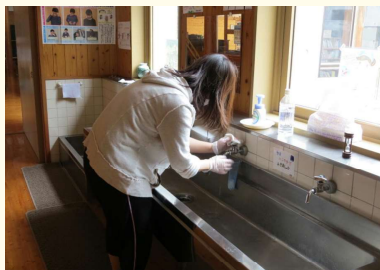
蛇口等手洗い場の消毒