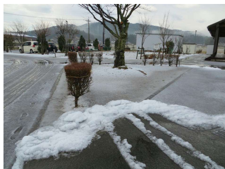
<校舎南側に積もった雪(1/15)>

今日は二十四節気の「大寒」で、1年で最も寒い時期となるはずなのですが……。寒に入ってもなかなか寒波がやって来ず暖冬傾向が続いていましたが、先週の15日の朝方ようやく積雪がありましたね。ちなみに、翌16日のスキージャンプ勝山の積雪は60cmとなり、ファンタジーサイトでの滑走がようやくできるようになったそうです。スキー場などにとっては恵みの雪となりますが、冬型の気圧配置が長続きしないため、悩みが去ることはないかもしれません。しかし、冬本番、油断は禁物です。心の準備は怠らないようにしていきたいものです。