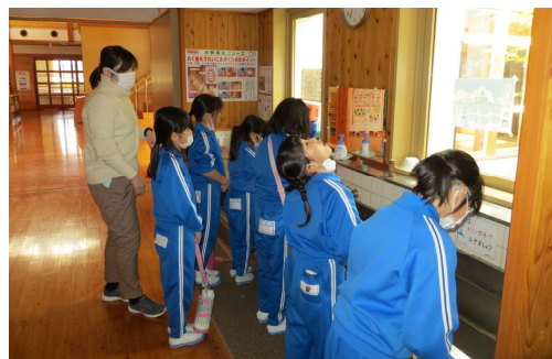
<手洗いやうがいに努めています>

さて、先週の保健だより(号外)でお知らせしましたように、本校でもインフルエンザA型が流行しはじめています。感染が拡大する可能性も十分に考えられますので、予防対策のご協力をお願いします。感染の機会が多くなりますので、インフルエンザウイルスを避けるためにはできるだけ人ごみを避けてください。学校でも、業間活動など一堂に会する場を減らすなどの措置をとりながら教育活動を進めていきます。ご家庭でも健康管理にはご留意いただき、体調が優れない場合は、検温や医療機関での早めの受診をお願いします。