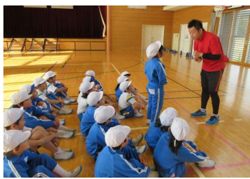
低学年体育支援事業 1・2年(11/26)