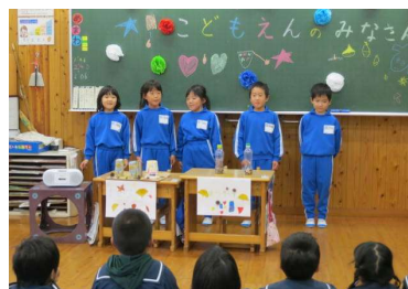
安養寺こども園との交流会 1年(11/28)