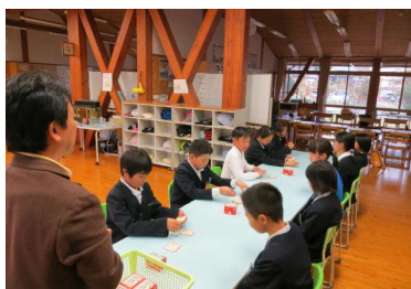
後期クラブがスタート(11/22)

火災の場合、避難にかかる時間が安全を左右します。ながながと注意や説明はできません。だからこそ、日頃の訓練が大切になってきます。