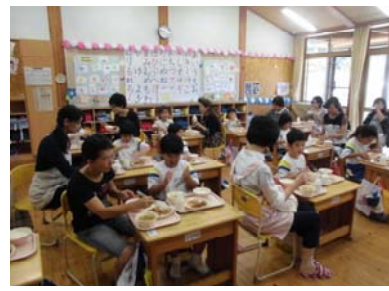
《1年生「給食試食会」の様子》