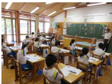
《発表もがばりました！》

また、この日は給食試食会も行われました。1年生の保護者の方に給食を試食していただき、その後話し合いがありました。この日の献立は、「かみかみ献立」で、ご飯、牛乳、鶏肉とごぼうの甘辛煮、もやしのゆかり和え、えのきのすまし汁でした。ごぼうは苦手な子が多いのですが、揚げることで食べやすくしてありました。1年生の保護者のみなさん、本校の給食の味はいかがだったでしょうか。