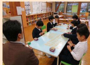
《五色かるたクラブ》