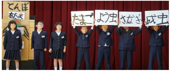
【3年】《楽しい学校生活》