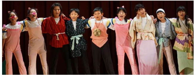
【6年】《SY nine stars の旅》

10月13日(土)の学習発表会には、たくさんの保護者やご家族の皆様にご参観いただき、ありがとうございました。毎日練習を重ねてきた歌や合奏、劇やダンス、また総合的な学習の時間で勉強した内容など、どの学年も一生懸命に取り組む成果を発表できました。行事で子どもは育つと言われます。子どもたち一人一人がこの行事を通して、努力することの尊さ、学ぶことの喜び、人を感動させることのすばらしさ、そして、やり遂げた達成感や満足感を十分に感じ取ってくれたことでしょう。皆様にはお子さまの様子をはじめから終わりまで温かく見守っていただき、ありがとうございました。人に見られるという意識が緊張感や成功したときの満足感につながり、子どもたちが持っている力をうんと伸ばすことにつながったことと思います。今後とも引き続き、本校の教育活動にご理解とご協力をお願いいたします。