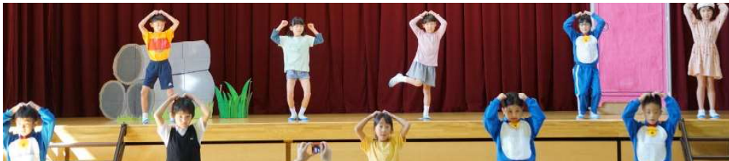
【2年】《ドラえもん、夢をかなえて!》