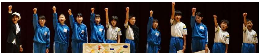
【5年】《5年生 VS 怪盗》