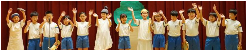
【4年】《金のおの、銀のおの》