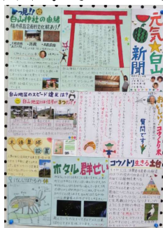
《優秀賞》 「元気☆白山新聞」 (上黒川町・堀町)