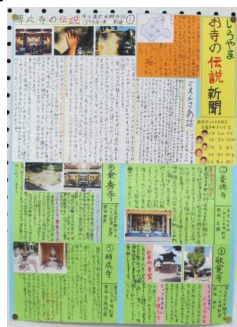
《優秀賞》 「しらやまお寺の伝説新聞」 (安養寺町)