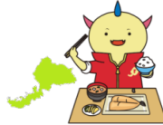
ぎょうじ とくべつ 行事食や特別な こんだてひ 献立の日