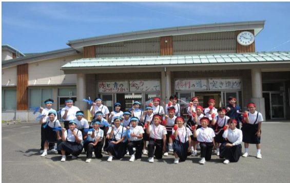
6年生全員でハイポーズ！！

子どもたちの晴れ舞台ですので、開閉会式や応援合戦の向きを変えたり、学年種目をフィールドで行ったりすることで、保護者の皆様ができるだけ観覧しやすいように努めました。お忙しい中、お越しいただきまして、ありがとうございました。また、マナーやルールを守ってご観覧いただきましたことに感謝申し上げます。