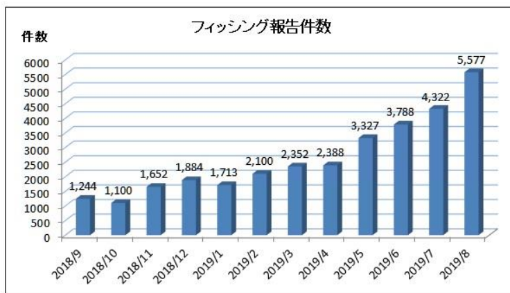
「フィッシング対策協議会」 2019/08 フィッシング報告状況より

フィッシング詐欺の報告件数は増加傾向（右グラフ）にあります。また、最近では手口が巧妙になってきており、下記のように すぐにはフィッシング詐欺であると判別できない ケースも増えてきています。