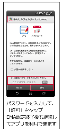
「あんしんフィルター for docomo」の場合