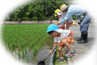
オタマジャクシ探し