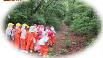
トトロの森 (村国山 市民の森)