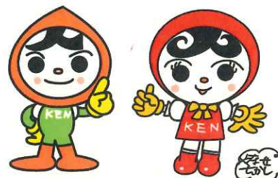
人権イメージキャラクター 人KENまもる君・人KENあゆみちゃん

福井県教育委員会 福井新聞社 NHK福井放送局 福井ユナイテッド株式会社 福井ネクサスエレファント